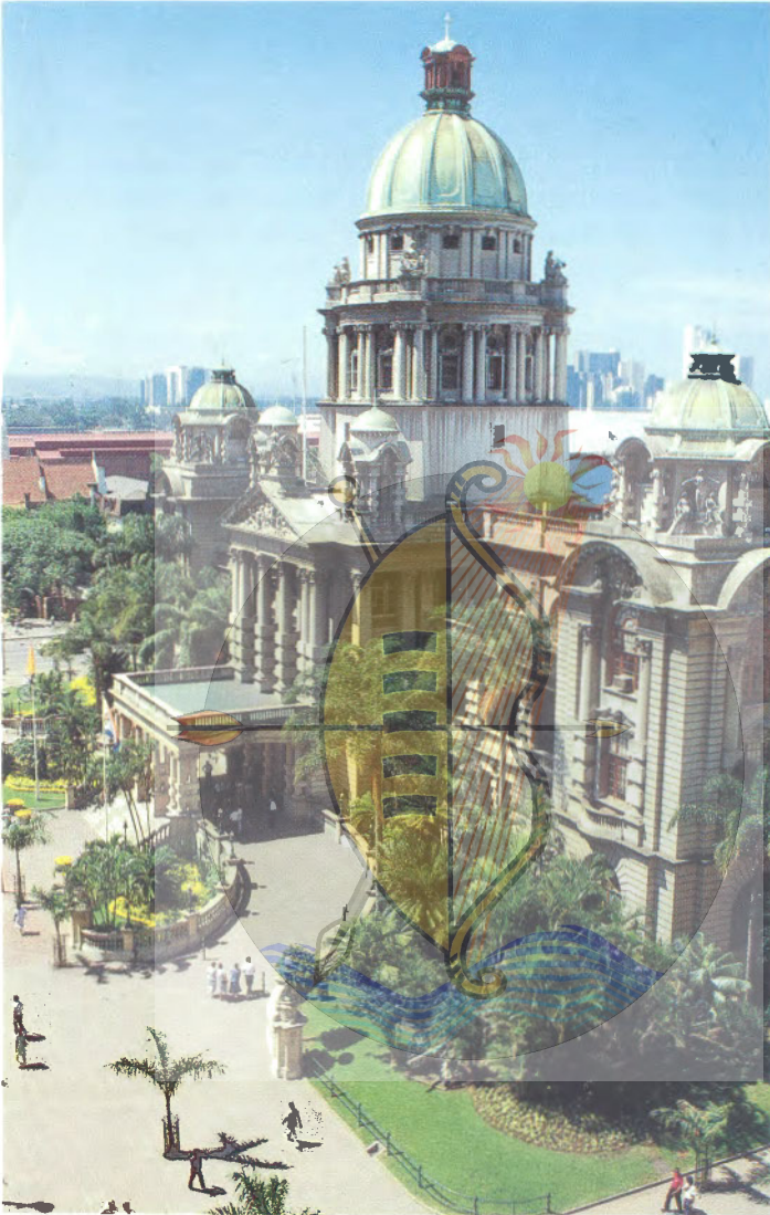
Durban se manjifieke Stadsaal waar die GUO vir Kwa-Zulu en Natal ingesweer is